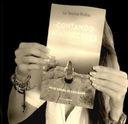
La Vecina Rubia