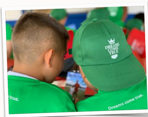
Dreams Come True, el lugar donde los sueños se hacen realidad

El fútbol playa es un deporte en auge en España y en la mayoría de los países europeos, los cuales, tomando como ejemplo la evolución de esta modalidad en otros territorios pioneros, dedican cada vez más esfuerzos a su profesionalización y a conseguir una mayor repercusión y un mayor número de adeptos. Desde Dreams Come True , pretendemos aportar nuestro granito de arena a través de valores como la disciplina, la cultura del esfuerzo, la humanidad, la humildad, el respeto, el trabajo en equipo y la inteligencia emocional. Una filosofía que nos permite sobrepasar cualquier límite y, por encima de todo, soñar en grande. Uno de nuestros sueños es traspasar fronteras y llevar nuestros conocimientos alrededor del mundo.